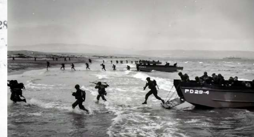
Imagen del posterior y definitivo desembarco en costas del norte de Francia.