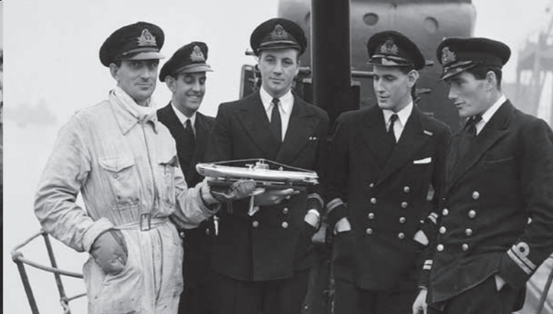
Miembros de la tripulación del HMS Seraph.